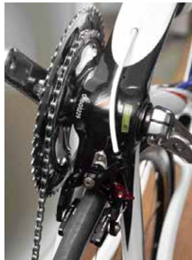
▲上在將來器埋藏在公路車架的五通下方，讓整體造型更加流線。