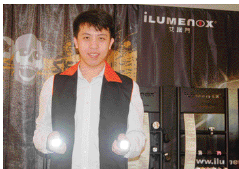
▲世陽企業主打的1瓦反射式車用前燈，利用反光板投射出符合德規光型設計，亮度為20 Lux。