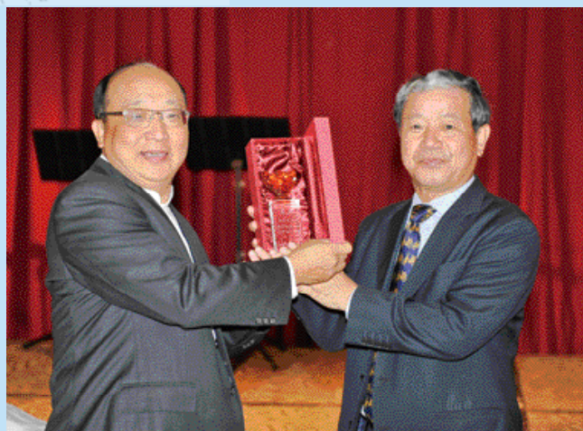
▲TBEA理事長楊銀明(右)代表業者致贈感謝獎座給台中市長胡志強(左)。