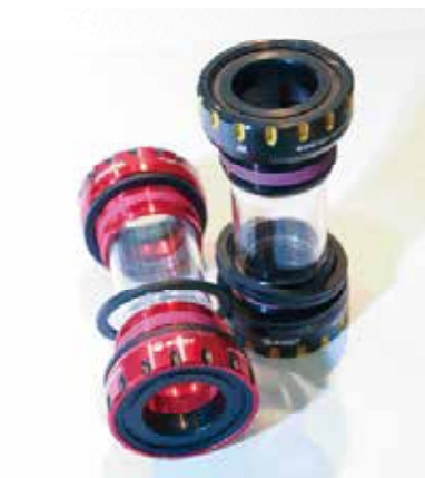
▲輪鋒最新的RN型號BB，可修正外掛式齒盤與軸心結合時垂直度不佳或是左右牙紋與五通產生的偏心。