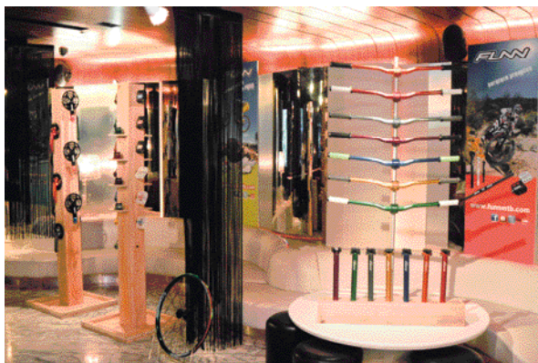
▲FUNN索性向永豐棧承租2F的酒吧做為meeting與展示新品的場所，注入更多活潑有趣的元素，讓客戶體驗悠閒的商務旅程。