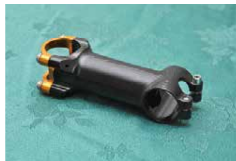
▲元城的豎管採用7075鋁合金，經過3D立體電腦銑床的製程，外型美觀，可適用於公路車與登山車。