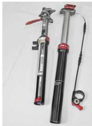
▲Kindshock可調式座桿已經達到成熟的階段，搭配6 inch的調整幅度，讓你自由自在掌握最佳騎姿。