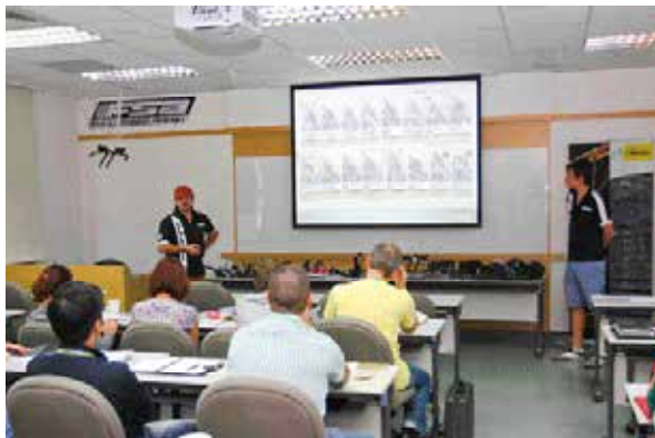
▲Ride On 分別使用 5 個會議室進行簡報，擁有隱密性與寬廣的空間可以靈活運用。

除了場內精采的新品亮相與概念交流，場外也舉辦試乘活動，參加者事先在官網上登錄資料，可領取紀念衫與借用 Mavic 車鞋，FSA 也提供全系列家族的產品測試騎乘，同時還可以飽覽大度山的城鎮風光，讓海外買主享受難得的悠閒。