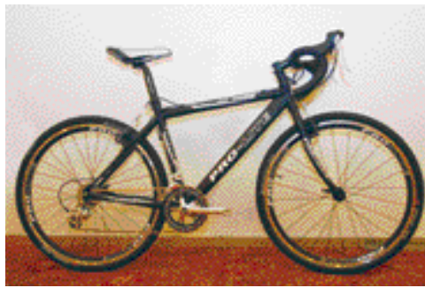
▲Pro-Lite特別針對青少年的身材與需求來設計車款，包括車架、輪組和各項零配件，讓青少年能擁有更適合自己的車款。