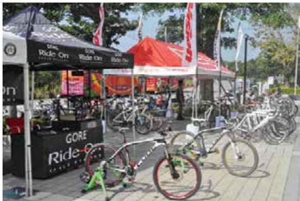
▲戶外產品體驗區可以讓產品經理實際感受產品的獨特魅力。