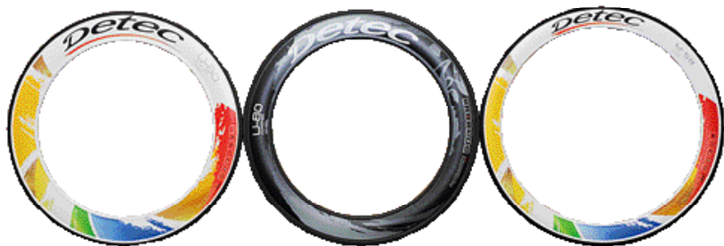
▲Detec Carbon輪組U-80與M-56流線的外型及優越的性能，採用3K碳纖維製成。