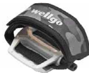
▲維格推出「踏板織帶」可以適用在Fixed-gear踏板上，不但增加許多便利性，相較於狗嘴套更顯得美觀整潔。