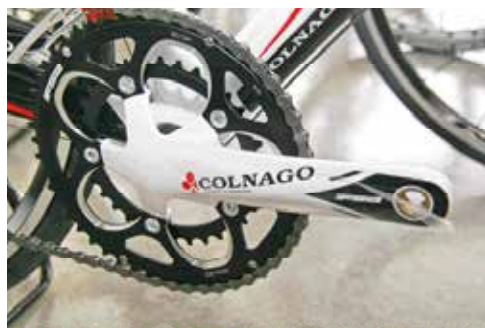
▲FSA針對知名的成車品牌提供客製化的服務。