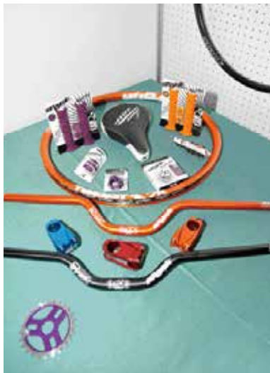
▲Spank展出Freeride及Downhill的車手把，讓各家產品經理頻頻點頭讚許。