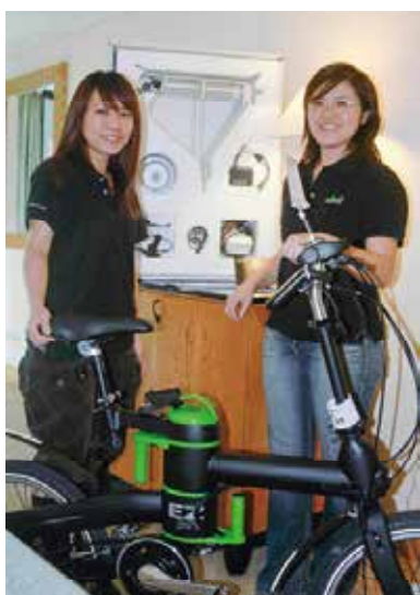
▲東庚推出的26吋折疊電動車搭配原有kit電動套件組。