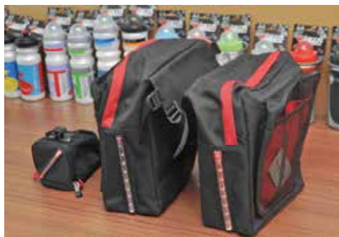
▲V-grip利用一顆LED的導光設計運用在後貨袋上，增加夜騎安全，1顆水銀電池可續航150小時。