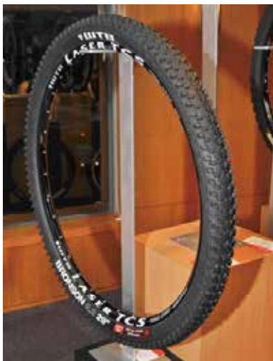
▲WTB Bronson 29吋輪胎，適用於多種路況，大顆粒胎紋讓車手輕鬆馳騁山林。