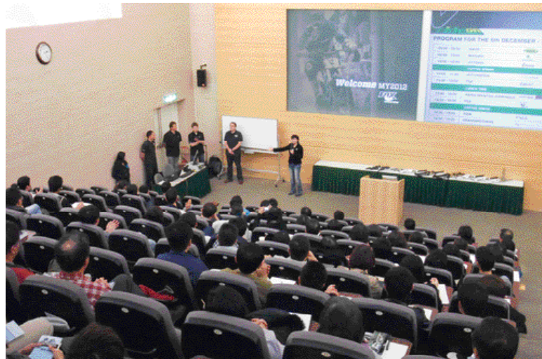
▲Ride On Taiwan Day 獲得台灣業者一致贊同。

Ride On 最後一日為 Taiwan Day，顧名思義就是為台灣組車廠和貿易商量身打造的，全程皆以中文說明，以馬拉松接力的方式，讓 10 個廠商分別以 30 分鐘依序進行重點式簡報，讓業界很有效率地了解 2012 年的產品趨勢，活動當天受到廣大迴響，台下聽眾無不拍手叫好。