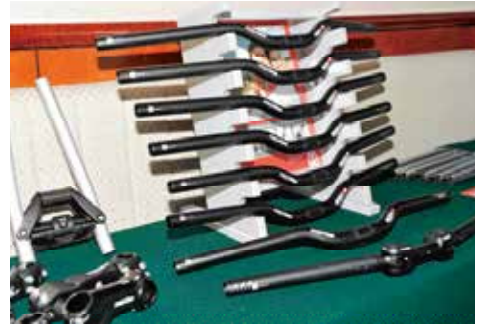
▲溫伯特Ergotech車手把針對人體的長度與重量設計，使用鈦材質製成，擁有更輕更強的特點，符合EN測試。