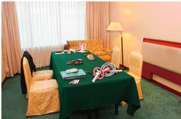
▲長榮酒店貼心至上，提供客房、會議室和宴會廳隔間等多元化的空間，讓廠商自行選擇。