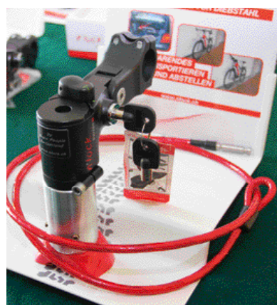
▲N'lock雙功能防盜鎖，將車鎖與豎管結合，讓騎乘者不用再另行攜帶鎖具，再搭配一條防盜鋼索即可使用，操作相當容易。