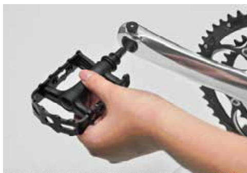
▲維格與FSA合作的「快拆式曲柄」，有別以往將快拆鈕設計在曲柄上，不但保留原本的便利性，同時解決可能不小心碰觸到QR的困擾。