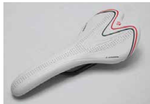
▲Velo VLS1737座墊符合人體工學，採用特殊吸震材料，擁有5倍吸震能力，隨著踩踏頻率座墊可跟著擺動。