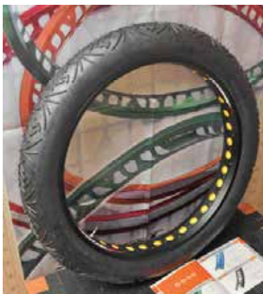
▲鑫權推出26吋輪框，可用於雪地路況，其他產品亦可提供客製化服務。