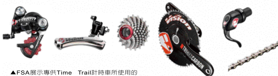
▲FSA展示專供Time Trail計時車所使用的Vision Metron變速系統。