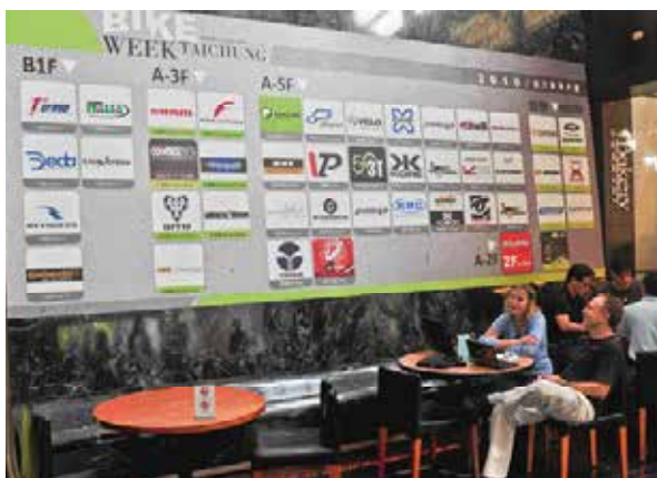
▲永豐棧相當重視TBW與來賓的蒞臨，在Lobby製作大型攤位指引，並且自行印刷參展商的分佈圖，讓參觀者迅速掌握觀展狀況。

為了提供賓至如歸的服務，永豐棧在飯店大廳製作大型的攤位指引，並且自行印刷參展商的分佈圖，同時免費提供茶水服務，可說是相當貼心。