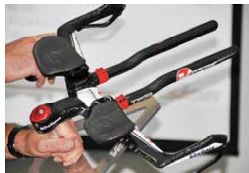
▲FSA推出可伸縮式休息把，廣受鐵人選手喜愛。