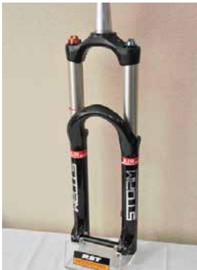
▲RST Storm Platform&Airadj避震前叉，擁有鎖死程度可調整功能。