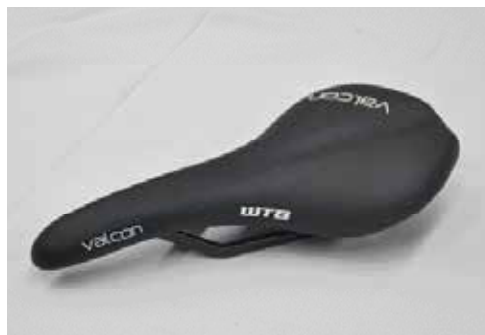
▲WTB Valcon座墊，座弓與底殼為碳纖維材質，擁有絕佳的舒適性，重量約160g。