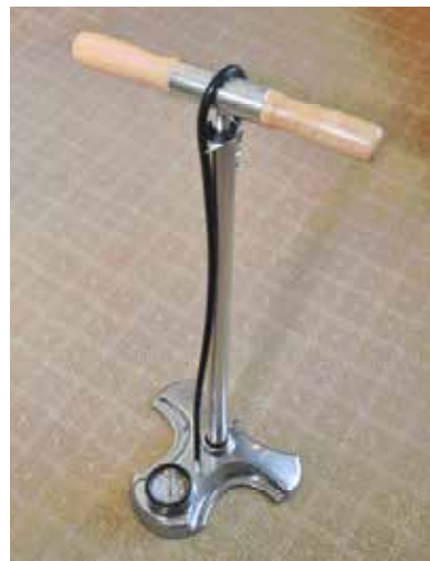
▲Airbone超省力直立式打氣筒，即便是嬌小的女性車友也能打得優雅自如，最高可打至300psi。