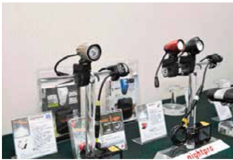
▲台萬旗下車燈Rainbow和Aurora照亮TBW，即將邁入30歲的台萬，充滿新朝氣，走向下一個30年。