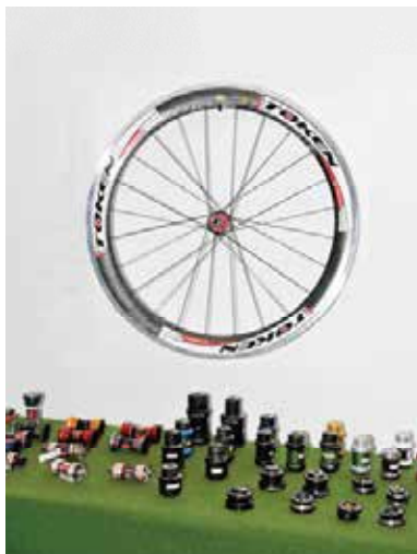
▲Token產品經過專業車手測試，以高品質貼心價格獲得許多產品經理的青睞。