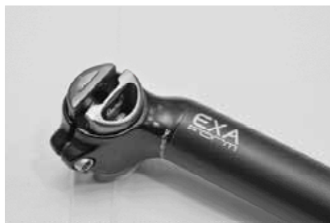
▲Kindshock Snaplock系統，擁有快速拆換座墊的優點，透過精確的刻度設計，可以任意調整喜歡的任何角度，不管上下左右通通隨心所欲。