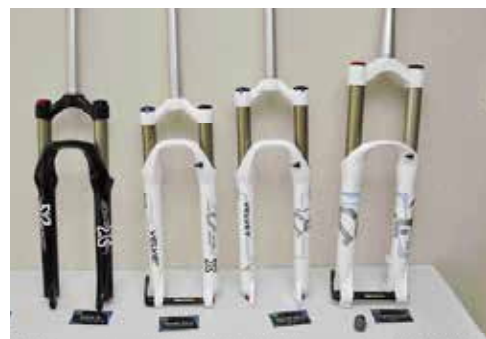
▲X-fusion提供全方位的產品線，以滿足組車廠的需求。