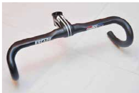
▲Controltech Escape一體式車把手，至少降低10-20%的重量，外觀簡潔俐落，使用對角式鎖固方式，以及小彎把設計。