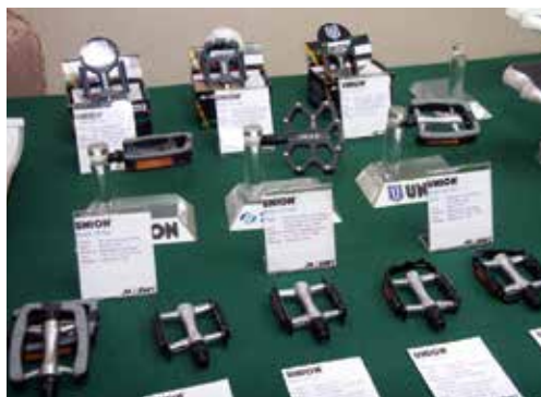
▲台萬主要針對OEM客戶展出其中高階產品。