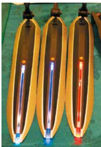
▲V-GRIP在泥除上加入一顆LED，配合導光式設計，方便集中光源；共有三種變化模式，三種顏色可選擇。