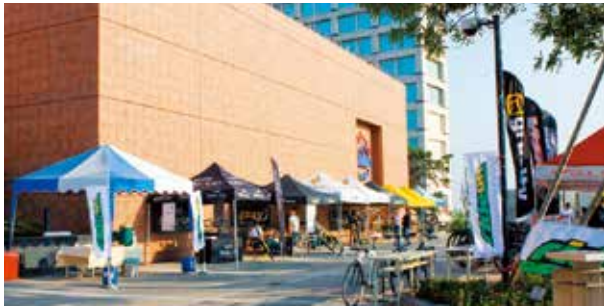
▲ Ride On位於台中南山教育訓練中心的戶外體驗產品區。