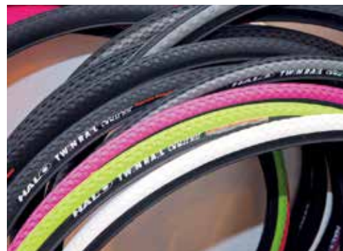
▲HALO的單速車輪胎，以中間質硬的概念，訴求更佳耐磨耗。