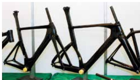
▲X pace展出各系列的碳纖維車架，其中三鐵車架有新的設計。