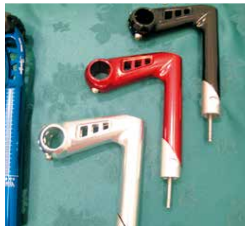
▲安爵推出精緻CNC一體成型的輕量化鏤空豎管。