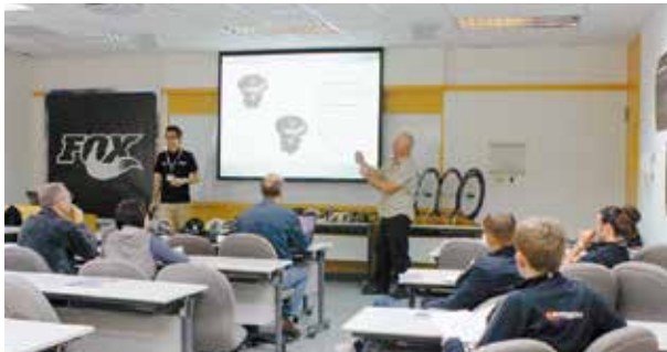
▲除了戶外展示外，也可以到會議室內聽取各品牌的簡報。

程皆使用中文說明，參與品牌包含 Crank Brother、Fizik、Fox、FSA、Vittoria、Hayes、Hutchinson、Magura、Mavic 都派專員和工作團隊一起進行產品簡報，對於現場反應的問題皆能立即回答，讓聽眾覺得很有效率。