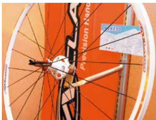
▲看準白色風暴即將席捲2010年，Alex推出登山車專用的白色輪組。