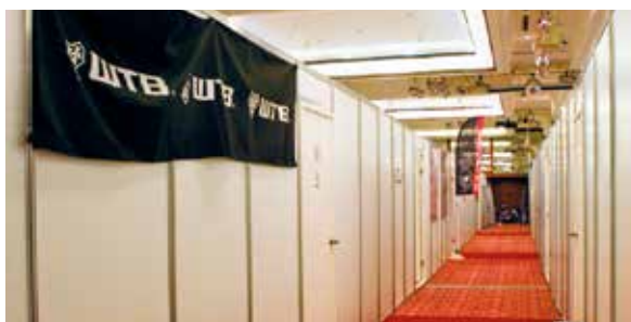
▲金典是以大宴會廳隔出許多會議室, 缺點是隔音效果不佳, 報價多少左右鄰居一清二楚。