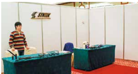
▲很多廠商參展都是為了爭取產品曝光機會與訂單, 所以在金典展出的 Syntex 乾脆設置為開放式的攤位。

果不佳, 有廠商笑稱報價多少隔壁都聽光了! 而且希望提早進場佈置的廠商認為, 直到開展前才能佈置, 時間不是非常理想; 此外也有廠商反應沒有茶水的服務, 相當不便。飯店內的位置及動線不明確, 搭乘電梯後還要再走上樓, 一樓看板也不明顯, 若要提升自行車週的效果, 應在各飯店門口應該有更多的指示。