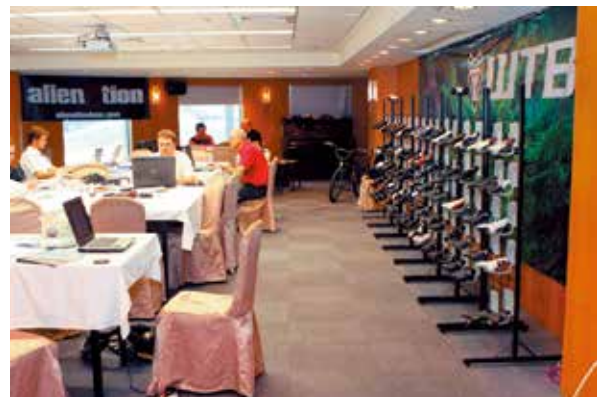
▲永豐棧3樓是相當寬廣的大會議室，WTB就已經連續多年在此舉辦閉門會議。