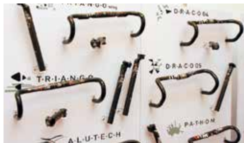
▲ITM展示一系列的碳纖維零配件。