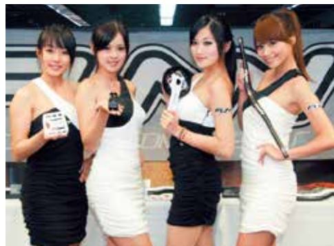
▲Funn昌竑2010年的重心以MTB零件為主，DH與XC為輔，產品線將更齊全；現場特別請了4位Show girl來做接待與展示產品的工作。