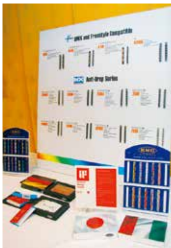
▲KMC今年主打的是輕量化的冠軍鏈條及各種彩色鏈條、愛國者國旗鏈。