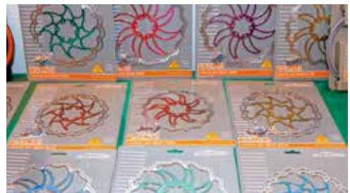
▲六穀主打多色系變化的碟盤。