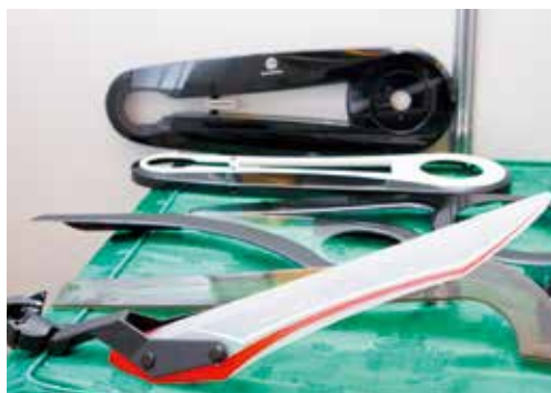
▲瑞振採用PP材質製成的後泥除，以鈕扣式快拆設計，而且產品包裝平整方便運輸，至於前泥除將在明年曝光。