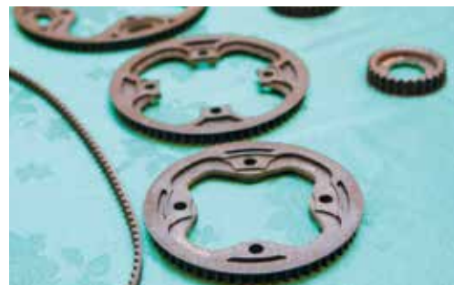
▲由典順企業代理的CDRIVE品牌，專製皮帶傳動系統，希望能避免鏈條所產生的缺點。