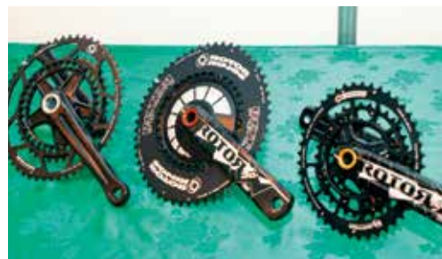
▲來自西班牙的Rotor展示造型特殊的大齒盤曲柄組，在轉動時能產生特別的視覺殘影。