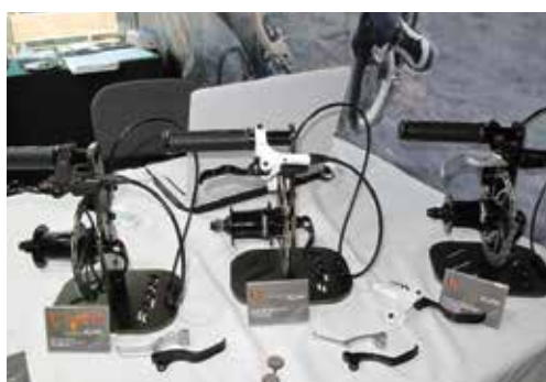
▲萬祥展出一系列Funn品牌碟煞產品。