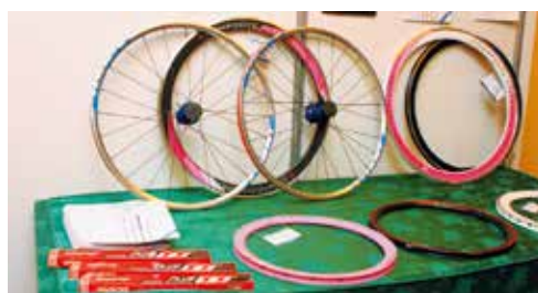
▲昆山捷安特在走道上的空間陳列各式輪組，拉近與客戶間的距離。