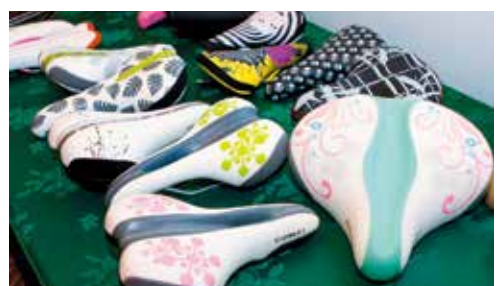
▲CIONLLI的座墊著重大膽的設計圖案，希望符合各類型騎乘者的需求。