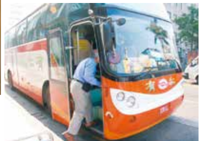
▲▶接駁公車對往返市區與南山人壽Ride On場地相當方便。