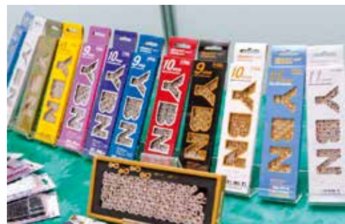
▲YBN高單價的鏈條加入自動潤滑的技術，可減少噪音。