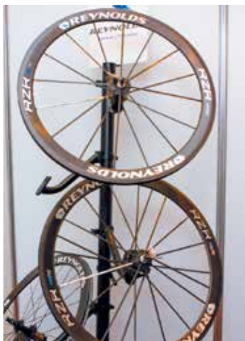
▲Reynolds R2R採用碳纖維材質與特殊編織方式，即便每組重量低於900g，卻能創造出強而有力的剛性。