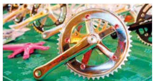
▲來自日本的Sugino展示單速車專用的大齒盤曲柄組，充滿流行尖端的設計。