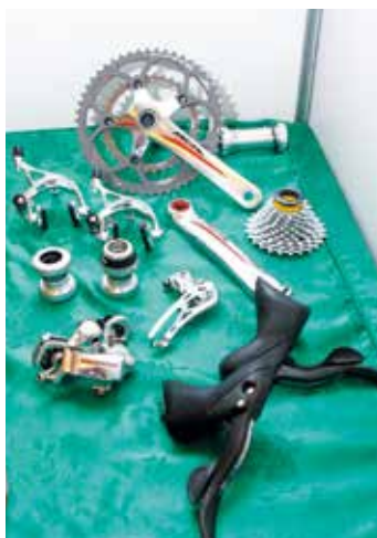
▲MICHE 11變速套件，可對應於Campy系統，其顏色外觀展露時尚質感。