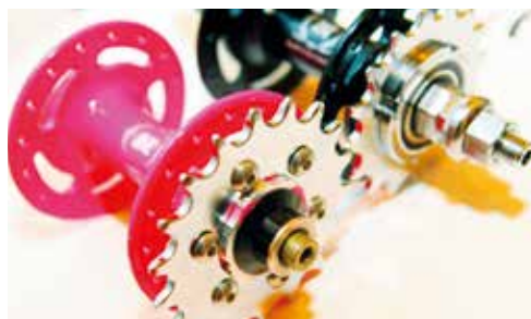
▲不讓輪組專美於前，久裕推出場地車專用的花鼓，強調安全性更高。