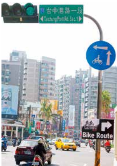
▲為引導國外人士從市區到大坑騎車，市府沿途設置了近兩百個路標指示牌。