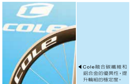
◀Cole融合碳纖維和鋁合金的優異性，提升輪組的穩定度。