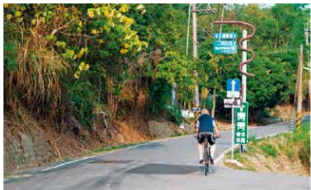
▲Bike Week的試乘路線是台中市政府極力推廣的自行車道，緊鄰大坑風景區，環境優美、自然景觀相當多元。