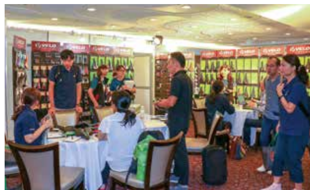
▲由於永豐棧的會議室空間不足，今年維格、維樂首度搬移到永豐棧大墩館二樓展出，會議空間寬敞許多，三天meeting很滿。