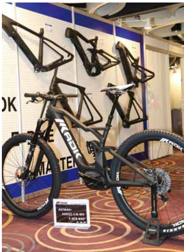
▲ADK配合各電機品牌開發多款碳纖維登山車架與公路車架。

Gecko Grip BB具有三大特點：最輕、最耐用、最容易組裝。使用碳纖維製造，只有70g。非常容易組裝與拆卸，過程不用1分鐘。解決壓入式BB會有不順的情況。另外，也改善異音的問題。規格為47T。