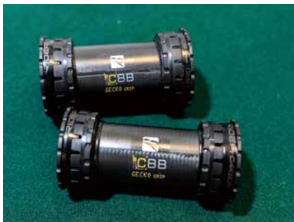
▲Gecko Grip BB具有三大特點：最輕、最耐用、最易組裝。