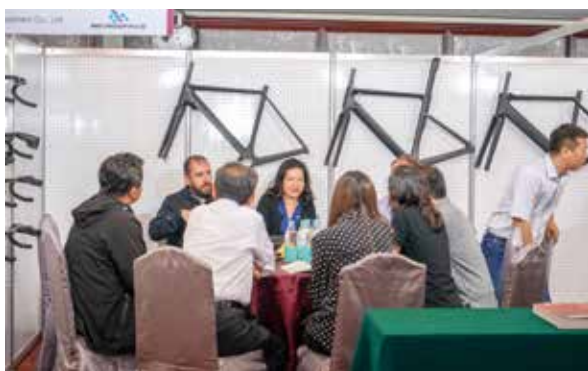
▲惠州飛博展出碳纖維車架與車把手。