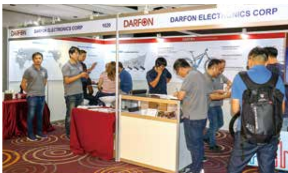
▲達方提供電動自行車關鍵零組件解決方案，吸引許多客戶上門。