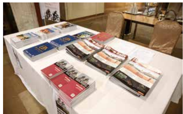
▲協辦單位輪彥公司編印參展手冊與每日展會快報，方便買主掌握最新的展會動態與新品資訊。