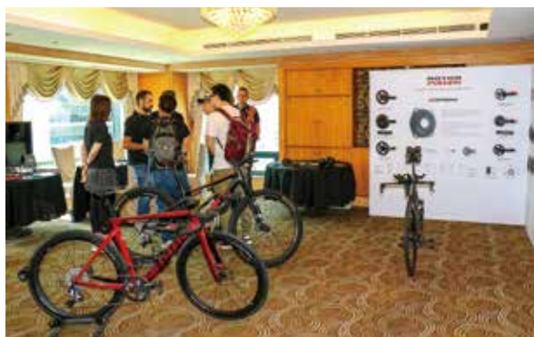
▲Rotor於金典酒店15樓會議廳展出。