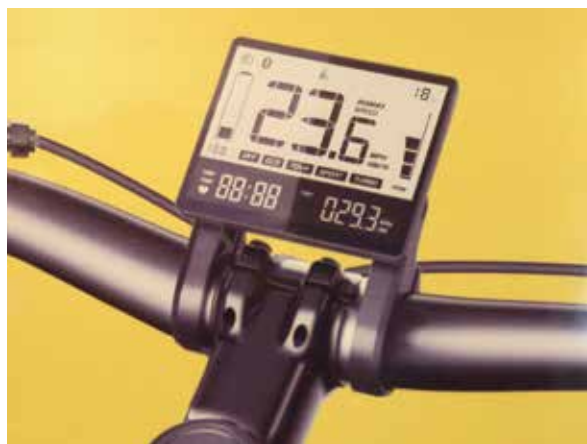
▲五星主推電動自行車的各种顯示螢幕，有登山車、公路車用的大螢幕，也有用於折疊車、滑板車的小型螢幕。