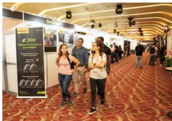
▲台中自行車週的展出效益受到肯定。

台中週的性質，主要是由海內外零件品牌商自發性地在各飯店內展出，邀請海外買主前來商談下個年度的新車規格及訂單，每年都吸引超過數千名國外探購買主前來參觀及洽談合作事宜。今年展期是在