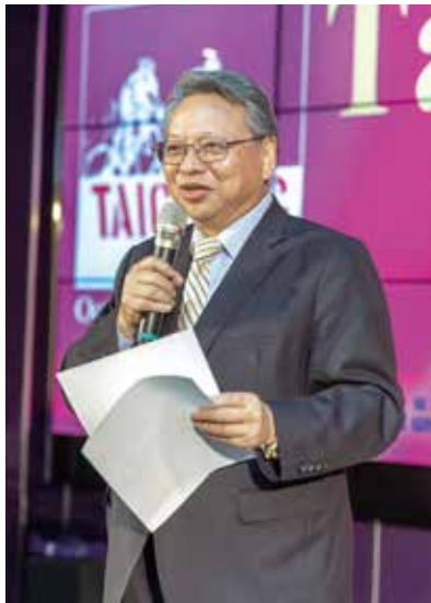
▲台中市副市長令狐榮達代表台中市政府與盧秀燕市長熱情歡迎全球自行車業者。