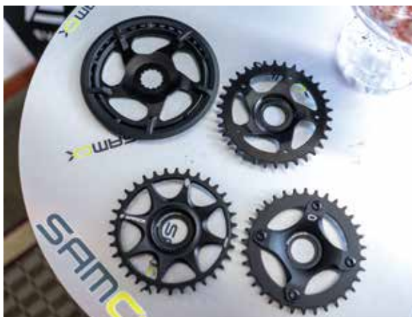
▲Samox 2020 e-Bike Direct Drive 齒盤。