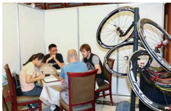
▲展輪在金典酒店15樓展出。