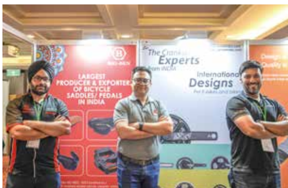
▲印度零件廠Big Ben Amar與Hartex首次參加台中週，他們表示明年會再參加。