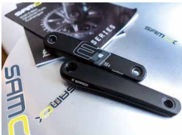
▲Samox 2020 e-Bike 曲柄。