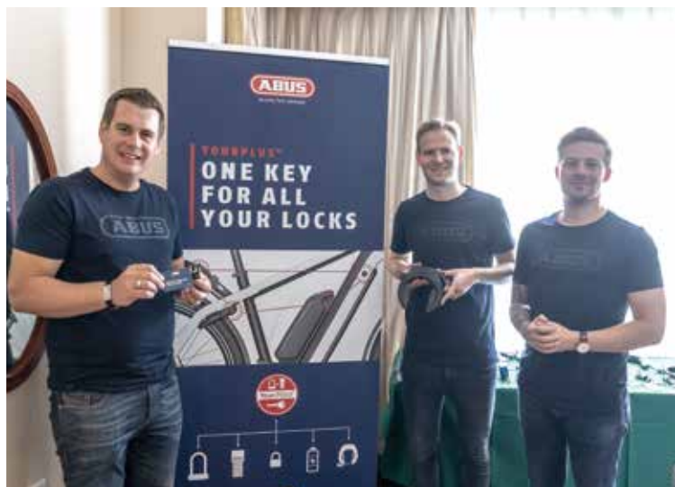
▲Abus團隊展示輪圈大鎖產品。