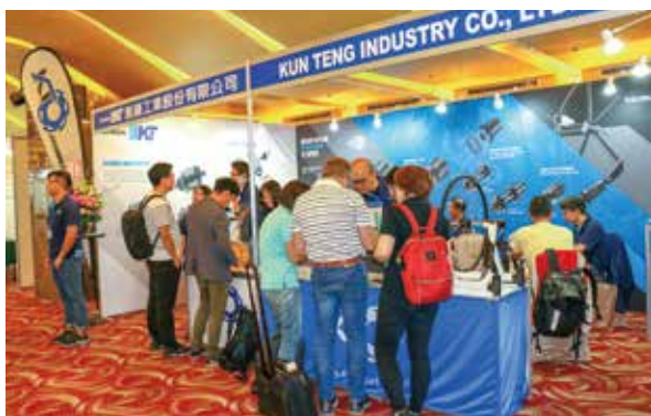
▲強調創新研發的崑藤，產品不斷推陳出新、掌握市場脈動。