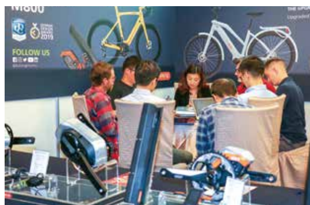
▲市占率不斷攀升的八方，在波蘭廠投產後如虎添翼，攤位上客人絡繹不絕。