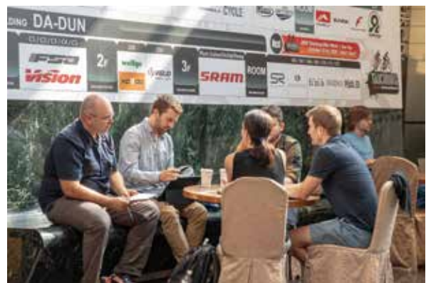
▲在永豐棧展出的業者每年都是和固定的客戶約好開會，所以會議行程依然滿檔。

也因為產業景氣不佳，不少廠商都縮減開支、減少參展，可以看到過去幾年很少有變動的攤位，今年卻有比較多都換了業者。但即使如此，空出的攤位都有其他後補的業者補上，整體的參出規模並未下降，畢竟許多廠商仍認為，台中週的展出效果比台北自行車展更好，有廠商表示，台中週的參觀者坐下來就是要談生意，不會像台北展雖然人很多，也換了很多名片，但實質效果卻不大。