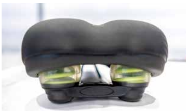
▲DDK記憶海綿座墊後方添加彈簧提升避震效果。